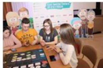
Игры, конкурсы, флешмобы