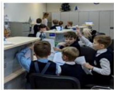
Экскурсии в банки